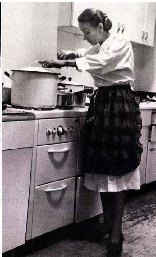
Marlene Dietrich Dîner chez L'Ange bleu